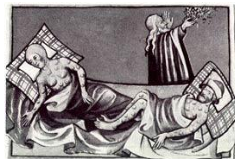
La Peste Negra en una ilustración de 1411

Crisis demográficas. Durante los últimos años del siglo XIII se había producido una notable expansión demográfica que permitió el crecimiento de las ciudades, el auge de la artesanía y la apertura de un comercio interior y la creación de rutas comerciales marítimas por el Mediterráneo y el Atlántico. En el siglo XIV la situación cambió radicalmente. Las grandes mortandades del siglo XIV alcanzaron enormes proporciones. La primera gran mortandad tuvo su origen en el hambre. Una serie de años muy lluviosos produjeron la pérdida de las cosechas entre 1310 y 1346, y el fantasma del hambre se extendió entre las clases más humildes. La segunda gran mortandad fue debida a la propagación de la epidemia conocida como peste bubónica o Peste Negra . La enfermedad, originaria de Asia, llegó a Mallorca en los barcos de los mercaderes en 1348 y desde allí se extendió por el reino de Valencia, para pasar después al interior de la Península. La Peste Negra, además de producir un descenso de la población, influyó en la vida económica y social de los reinos, en las mentalidades de las gentes y en las manifestaciones artísticas y literarias.